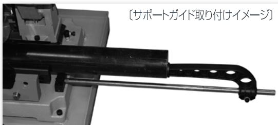
(サポートガイド取り付けイメージ)